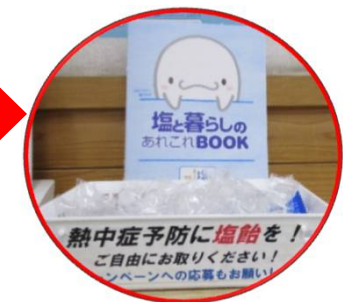
道場内のポスターと塩飴