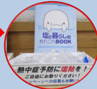
道場内のポスターと塩飴