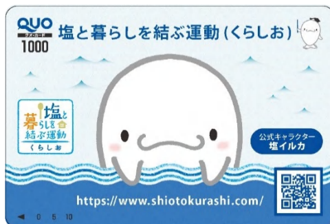
オリジナル QUO カード