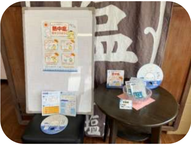
備後塩元売株式会社

備後塩元売株式会社（広島）、徳島塩元売株式会社、伯方塩業株式会社（愛媛）でも、事業所にポスター等を掲示・設置しました。