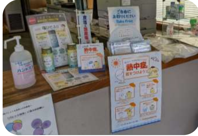
徳島塩元売株式会社