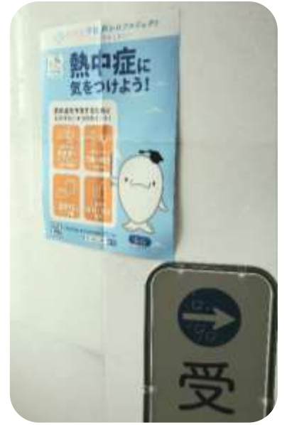
伯方塩業株式会社