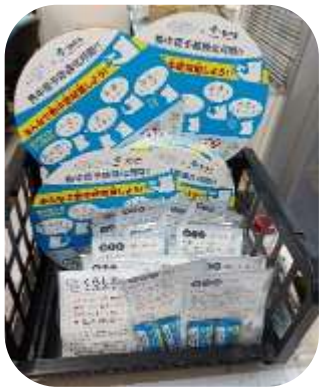
加能塩業株式会社