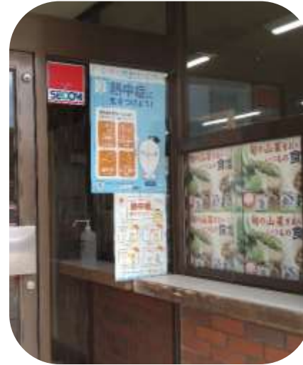
北陸塩業株式会社