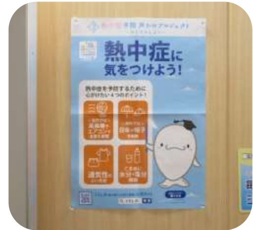
吉田塩業株式会社